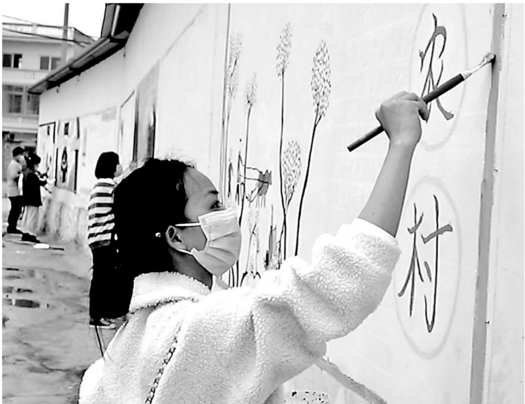
春节期间，港南区瓦塘镇组织多名返乡大学生在村文化长廊画板报，用笔和颜料描绘农村发生的翻天覆地变化，助力乡村风貌提升。图为大学生们正在作画。

为保障春节期间旅游环境安全稳定，该区在春节前期开展了假日文化旅游市场安全大排查，就假日旅游各项工作进行了部署，并重点对荷美覃塘景区、九凌湖景区、灵龟宝山乡村旅游区、凯莱美假日酒店、富丽城酒店等重点景区景点和涉旅场所开展疫情防控和安全生产检查。春节期间，各景区景点及文化场所做好常态化疫情防控工作，安排足够的安保人员维持秩序，春节期间无重大安全责任事故、无重大投诉发生，景区运行平稳有序，确保了游客出行安全。