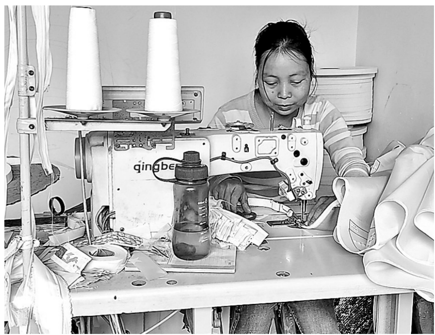
春节过后，贵港市港南区林冠家具加工厂也迎来开工，该工厂成立于2018年，位于港南区八塘街道新家村，主要经营加工衣柜布套，目前该厂日产500套衣柜布套，年产值100万元。该工厂的扶贫车间吸纳15名周边群众务工增收，每人每月收入约2000元。图为2月21日，工人在车间工作。