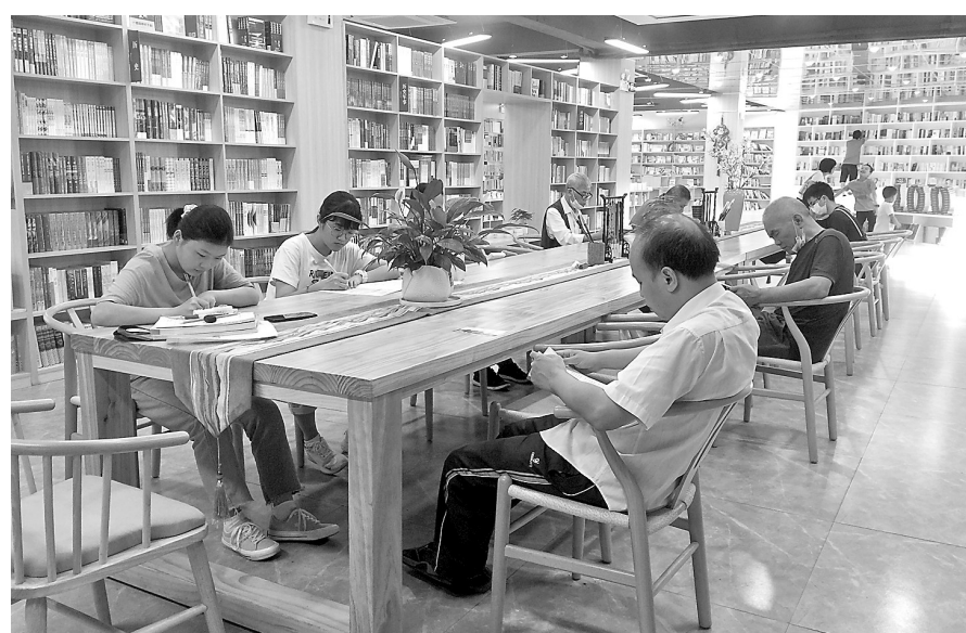
“五一”小长假，不少市民选择到书店为自己“充电”，在静谧舒适的环境中，尽情享受阅读带来的乐趣。图为5月4日，市民在新华书店看书。