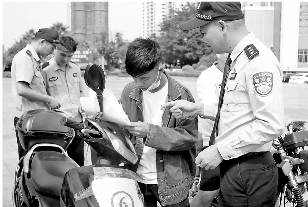
4月29日上午，市公安局港南分局集中返赃大会暨安全知识宣传活动在港南区行政中心广场举办。当天，港南警方向受害群众集中返还被抢抢两轮车、手机等一批赃物，并通过现场播放视频、发放宣传手册等形式，向群众宣传反诈、反恐、反邪教等安全知识。图为返赃现场。（记者欧钰宇摄）

一年之计在于春。为了大地的丰收和实现全年的经营目标，该厂党员干部职工发扬“孺子牛、拓荒牛、老黄牛”精神，开展党史学习教育，促进生产经营。今年以来，他们开足马力生产，日产化肥800多吨。针对春节期间销售旺季，外地工人休假返家的情况，从农历正月初三开始，厂领导、机关科室干部和车间下班的员工全员上阵装肥料、卸原料，最多的一天装车100多辆共2000多吨，卸原料车20多车共400多吨，得到了客商的好评。该厂积极开拓市场促进销售，今年第一季度，该厂成功打开东兴市、富川县和柳城县等地的化肥市场，共销售化肥8000多吨。