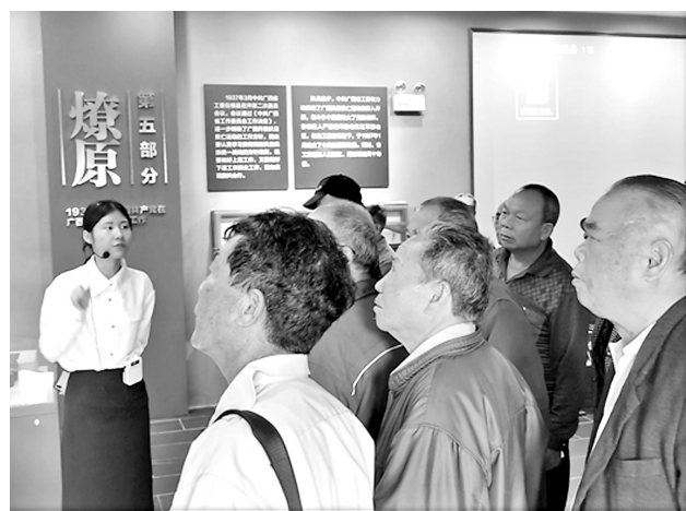
近日，港北区组织退休党员干部赴中共广西省代表大会旧址开展党史学习教育，缅怀革命先烈，传承红色精神。图为老干部在认真听讲解。

分享会上，青年党员干部分享了阅读《中国共产党简史》《论中国共产党历史》《毛泽东邓小平江泽民胡锦涛关于中国共产党历史论述摘编》及《习近平新时代中国特色社会主义思想学习问答》的感悟，集体诵读毛泽东诗词《水调歌头·重上井冈山》并现场谈感受，交流党史学习教育的心得，从不同角度阐述党走过的艰辛和辉煌的历史，表达对党和祖国的热爱，并表示要传承和发扬老一辈革命家的优良作风和革命精神，做一个主动作为、勇于担当的贵港公路人。