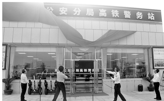
4月30日,市公安局港北分局高铁警务站揭牌启用。高铁警务站将有效维护高铁站和周边地区的社会治安,为广大旅客出行提供安全稳定的治安环境。

《建党伟业》生动再现中国共产党成立的峥嵘岁月。检察干警观影后,表示要发扬党员的先锋模范作用,切实做到学党史、汲力量、办实事,并立足检察职能,以优异成绩向建党100周年献礼。(李映秀)