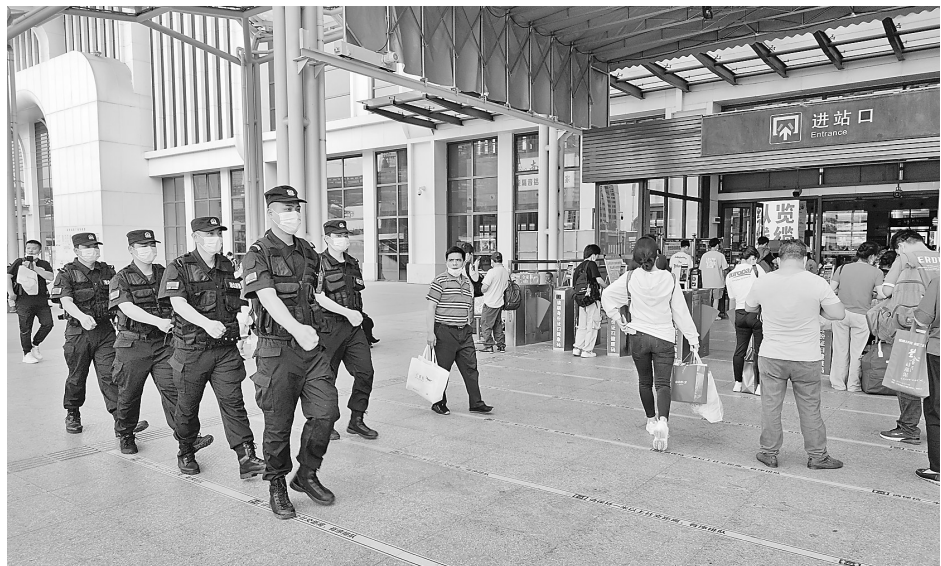
“五一”假期期间,市公安局强化社会面巡逻防控,加大对人流密集场所以及治安复杂、案件高发、防范薄弱区域的巡逻防控力度,确保我市社会治安大局平安稳定。图为民警在高铁站执勤巡逻。

最后,港北警方还特别提醒广大市民:不要裸聊和虚拟购物;不要刷单和轻信客服退款;不要网络贷款,不做网络投资!