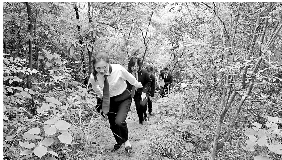
为扎实推进党史学习教育,近日,覃塘区人民法院党支部组织全体党员到樟木镇渡动村开展以“学党史、汲力量、促前行”为主题的党日活动,通过聆听革命故事和参观教育基地等方式,重温波澜壮阔的革命历程。图为该院党员重走瞭望古道革命道路。

经了解,该女子因家庭矛盾,从贵港城区离家出走来到桂平,拒绝与家人联系,走到西山水库边,一时想不开,产生了轻生的念头。民警通过进一步教育劝导,女子心结得以解开。当正为亲人失联而报警的女子家属接到西山风景区派出所民警的电话时,嚎啕大哭,激动万分,对民警连声道谢。当日下午5时许,女子家属来到派出所将其接回家。