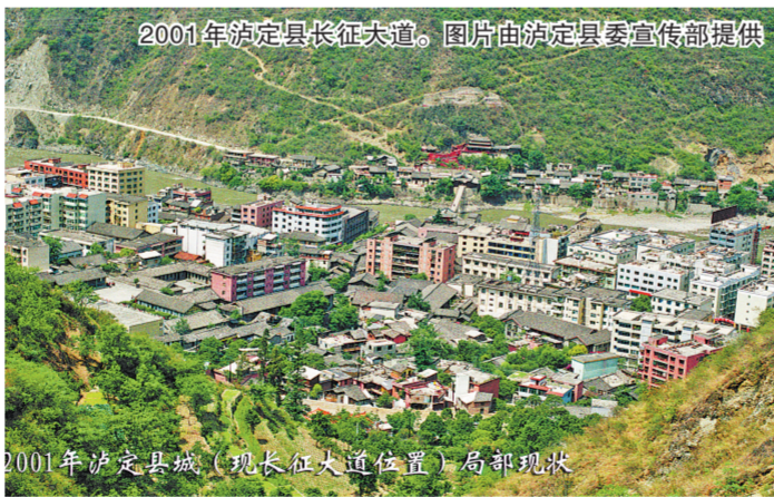
2001年泸定县长征大道。

泸定,既是革命老区,又是民族地区,更是一片英雄的土地。红军长征在泸定的村村寨寨留下了战斗足迹,撒下了革命火种,传播了伟大的长征精神。 红军长征虽已远去,但长征精神却在时代中淬火升华,历久弥新,激励着中华儿女夺取革命、建设和改革的一个又一个胜利。 每一代人都有每一代人的长征路,每一代人都要走好自己的长征路。站在新的历史起点上,泸定各族群众正在巩固脱贫攻坚成果、接续乡村振兴的伟大实践中,不忘初心、继续前进,为实现“两个一百年”奋斗目标、实现中华民族伟大复兴的中国梦贡献泸定力量。