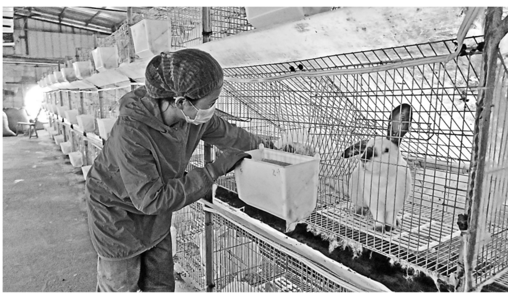
港北区庆丰镇延塘村免鸭循环养殖基地，利用免粪便饲料化再利用技术养殖青头鸭，实现生态循环的产业发展之路。该基地由村民合作社具体运作，收益实行“保底分红+收益分红”，使村集体年收入达到10万元。图为5月14日，基地务工人员正在查看兔子的生长情况。