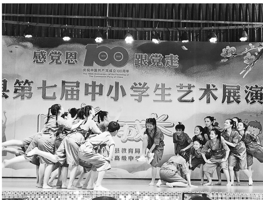
为庆祝中国共产党成立100周年，5月14日，平南县第七届中小学生艺术展演在大安高中举行，此次展演主题是“感党恩，跟党走，阳光下成长”，分歌舞表演、绘画作品展、美术工艺品展等。图为歌舞表演现场。

文化振兴是乡村振兴之魂，我市广大文艺工作者要积极参与到乡村振兴中去，深入乡村，深入生活，开展形式多样、内容丰富的基层文化活动，用文化艺术助力乡村振兴，实现艺术与乡村振兴的有机融合与共生互进。