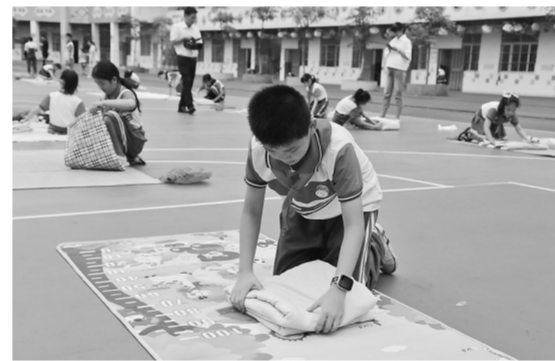
5月31日，港北区建设小学举行“学党史 感党恩 迎六一 展技能”校园劳动实践比赛，比赛项目有整理书包、叠衣服、叠被子、钉纽扣、缝沙包、刷鞋子等。