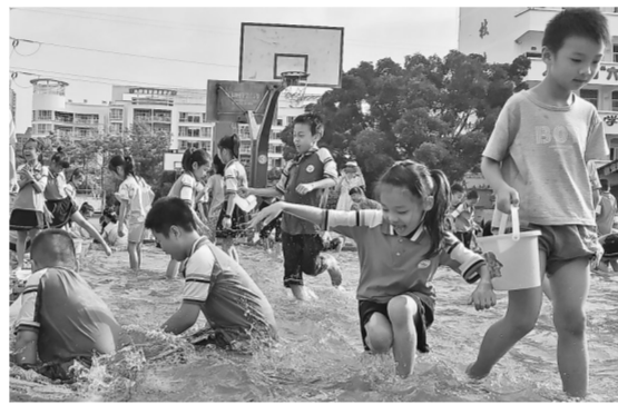
5月28日，港北区新世纪小学举行庆“六一”抓泥鳅比赛。（记者易丹琴 本报特约摄影师周金有摄影报道）