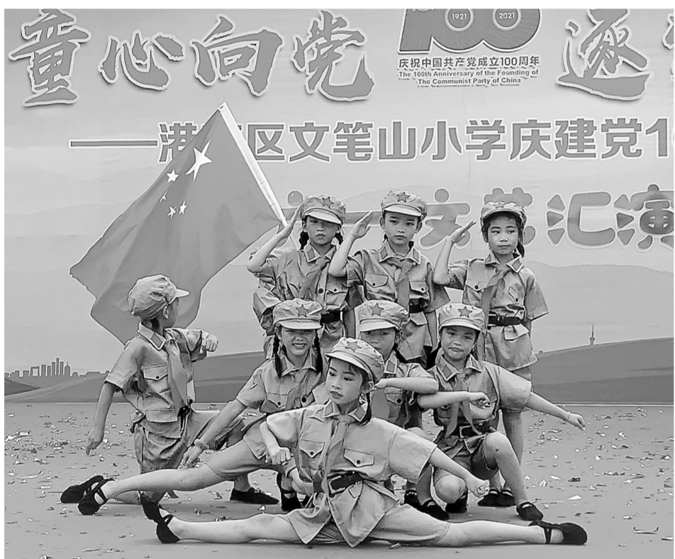
▲5月28日，港南区文笔山小学举办“童心向党 逐梦新征程——庆建党100周年暨‘六一’红色主题文艺汇演”，小学生们用多种艺术形式庆祝自己的节日，传递心中的喜悦，表达对党和祖国的热爱。