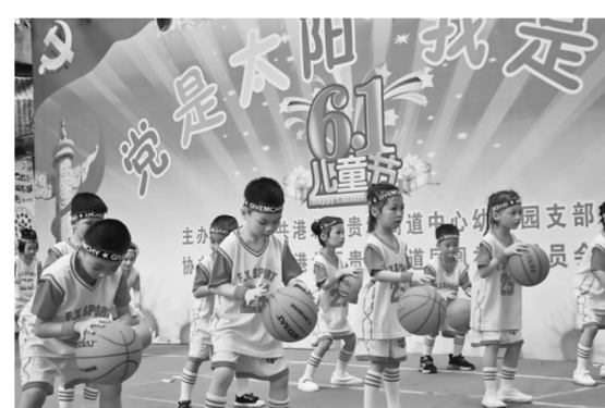
5月31日，港北区贵城街道中心幼儿园开展“党是太阳我是花”庆“六一”活动。