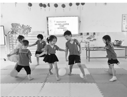
5月31日，港北区中山幼儿园开展丰富多彩的活动庆祝“六一”儿童节。