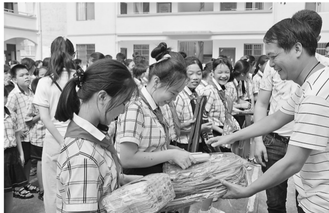
5月27日，贵港鑫阁木业、桂马木业、太平洋木业有限公司等企业到港南区新塘镇和小学开展爱心捐赠公益活动，为孩子们送上书包、文具盒、体育用品等，并为学校捐赠办公桌椅一批，改善学校的办公条件。图为捐赠现场。