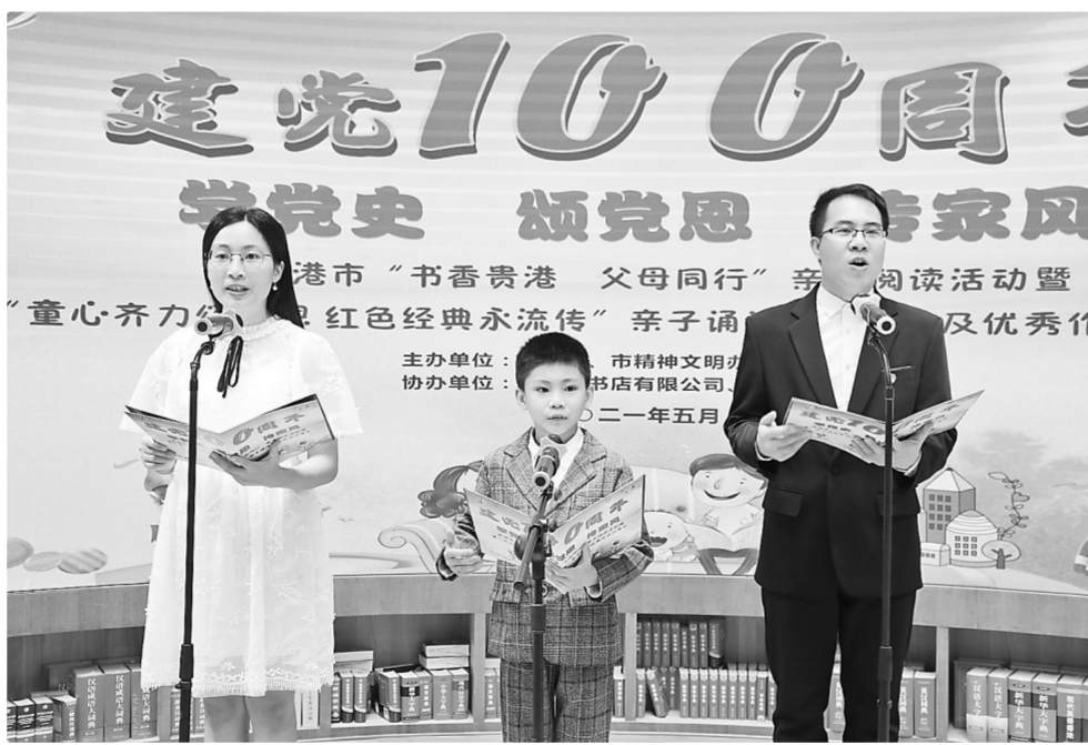
5月27日，贵港市2021年“书香贵港 父母同行”亲子阅读活动暨“童心齐力 颂党恩 红色经典永流传”亲子诵读比赛颁奖及优秀作品分享会在贵港市荷城书苑举行。图为获奖的家庭代表朗诵优秀作品。