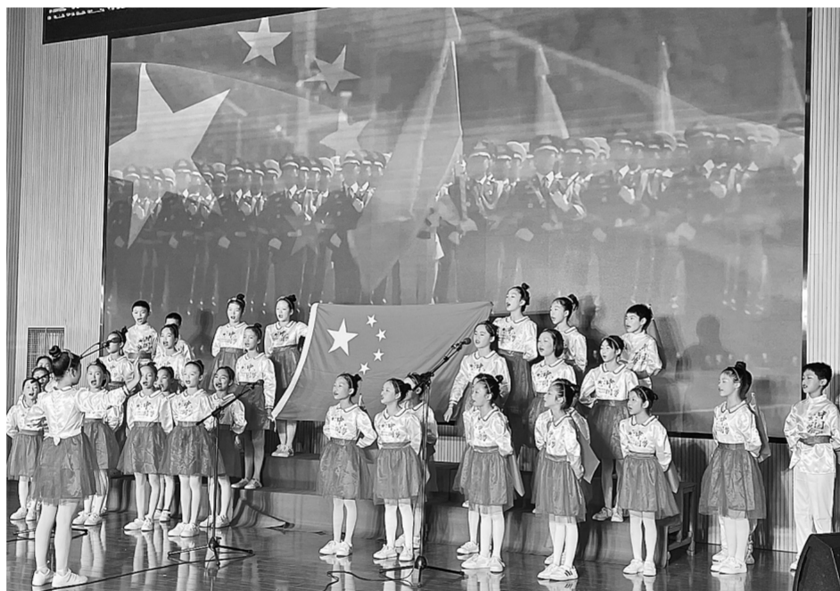
5月31日，港北区教育系统“感党恩 跟党走”系列活动之红色歌曲合唱比赛在港北区第二初级中学举行，来自贵城、荷城、港城等9大学区共450多人参加。活动旨在推动党史学习教育进一步深入群众、深入基层、深入人心，引导青少年热爱党、拥护党、听党话、跟党走，热情讴歌党领导人民取得的丰功伟绩。