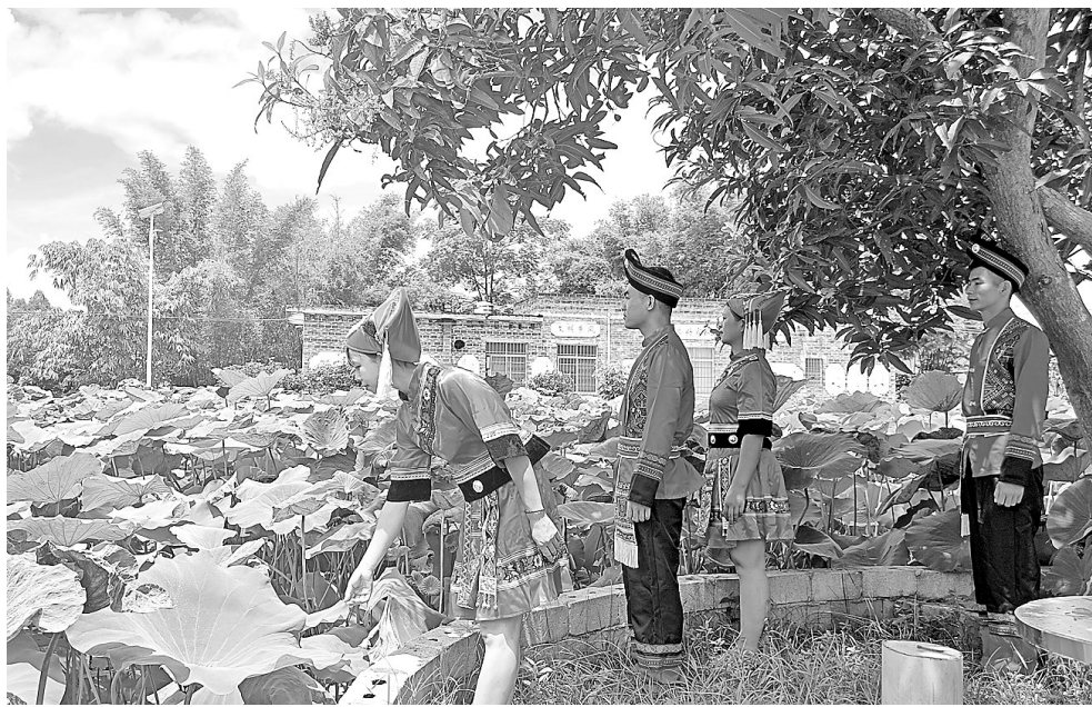
桂平市江口镇东升村百益屯近年来通过党建引领，大力开展风貌改造、产业提升、文化传承等乡村建设，取得良好成效，乡村风貌焕然一新。图为7月9日，荷花盛开时，该屯壮族青年男女在荷塘边赏荷，欢唱美好生活。（见习记者刘锐军 通讯员陈宜军摄影报道）

贵港讯 日前，贵港海关缉私分局开展打击濒危物种走私专项行动，成功打掉濒危物种走私团伙1个，端掉濒危物种囤积窝点2个，现场查获涉嫌走私穿山甲鳞片2245.995千克、穿山甲爪子2.093千克，抓获犯罪嫌疑人2个。 在专项行动首次查缉行动中，贵港海关缉私分局民警在江某某、张某某租用的仓库、住所以及物流公司查获穿山甲鳞片、穿山甲爪子1025.668千克。后经深挖扩线，又在他们租用的另一个仓库再次查获穿山甲鳞片1222.42千克。该分局随即成立专案组对该案开展立案侦查，发现江某某、张某某通过越南走私团伙购买穿山甲鳞片后，由越南走私团伙委托中越边境保货团伙将货物从广西东兴边境非设关地偷走私入境并运到玉林，再销售到国内各地牟利。经查证，该案涉案的穿山甲鳞片、穿山甲爪子达7919.99千克。 目前，涉案的2人已经被依法执行逮捕，案件在进一步侦办之中。 (王锦昆)