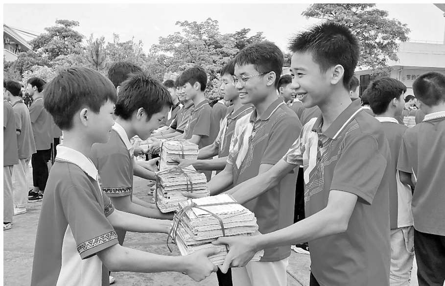
近日，覃塘区三里一中开展以“知识共享，爱心飞扬”为主题的赠送课本活动，2021届毕业生纷纷将自己的课本和笔记赠送给2022届的学弟学妹们，以传递书籍的形式传递知识与爱心，激励学弟学妹们认真学习。