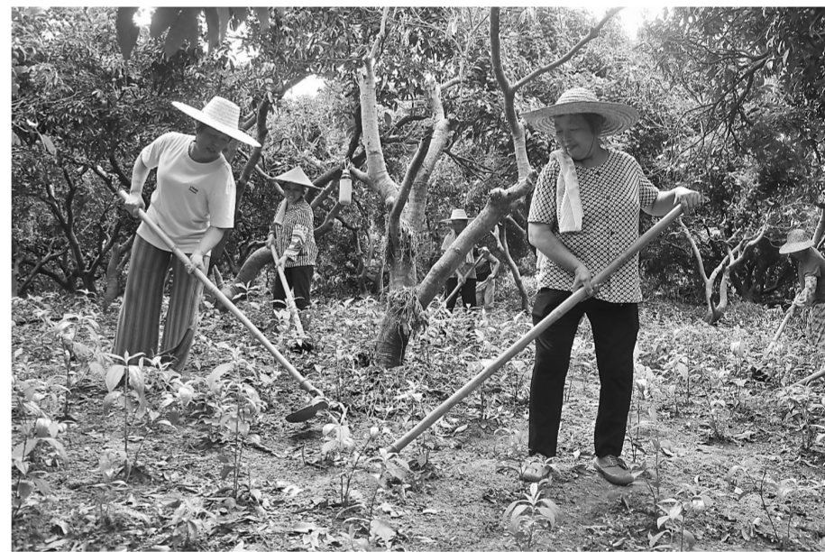
桂平市社埭镇积极打造乡村振兴特色产业,投入140多万元在光明村白糖荔枝基地套种150亩中草药草珊瑚,预计可增加收入约60万元。图为7月23日,农户在护理套种的草珊瑚。

稻虾综合种养成为我市乡村振兴的“新引擎” 本报讯(记者谭彩珍 通讯员陈美东)7月19日,港南区在东津镇雷村举行稻虾综合种养产业发展项目开工仪式。该项目总投资2.5亿元,稻虾种养规模为3000亩已完成土地流转1000亩,主要养殖澳洲小龙虾等优质品种。目前,该区共签订稻虾种养土地流转协议2万多亩。 今年以来,我市把稻虾综合种养作为实施乡村振兴战略的新抓手,确立在“十四五”期间实现“百亿渔业”目标,着力打造“中国南方小龙虾之乡”,力争到2023年全市稻虾综合种养面积达到30万亩,小龙虾年产量5万吨以上,产值25亿元以上。市委、市政府多次召开现场会、专题会,并印发《贵港市稻虾综合种养产业发展方案》,研究部署稻虾综合种养工作。同时,加大土地流转和招商引资工作力度。此外,还加强科技支撑力度,邀请区内外高等院校、科研单位的专家、教授对我市稻虾产业进行指导,不断提升稻虾种养技术,并着重引进二、三产龙头企业,着力打造小龙虾养殖-加工-销售-餐饮服务全产业链,提高稻虾经济效益。截至6月底,全市完成土地流转面积10万多亩,其中签约稻虾种养面积8万多亩,完成全年目标任务的80%。预计到年底,全市将有5万亩稻虾综合种养面积投产,鲜虾产值3亿元以上。