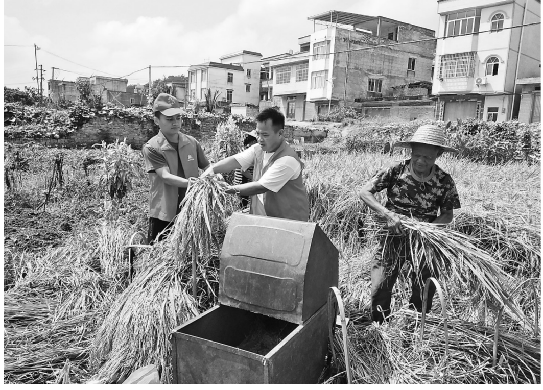
近期,平南县大洲镇志愿者服务队持续开展新时代文明实践五进家门“拉话话”活动,进村入户为群众疏情绪、讲政策、传知识、改思想、解困难。图为7月23日,志愿者为大洲镇蓝垌村群众收稻谷。