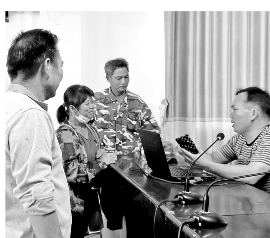
7月21日,港南区木梓镇开展农业技术科学普及志愿服务活动,就种植技术、科学安全使用农药、草地贪夜蛾防治等进行培训。图为授课现场。