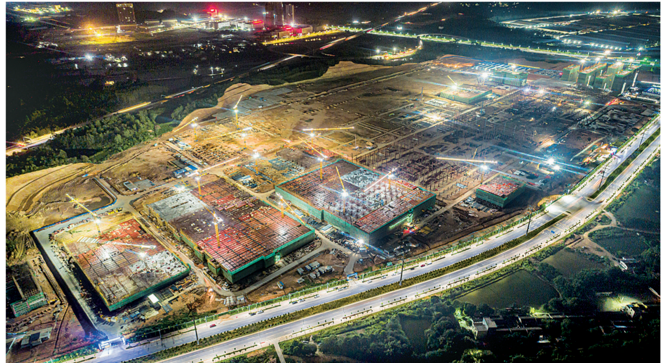
灯火通明的瑞庆时代建设现场。