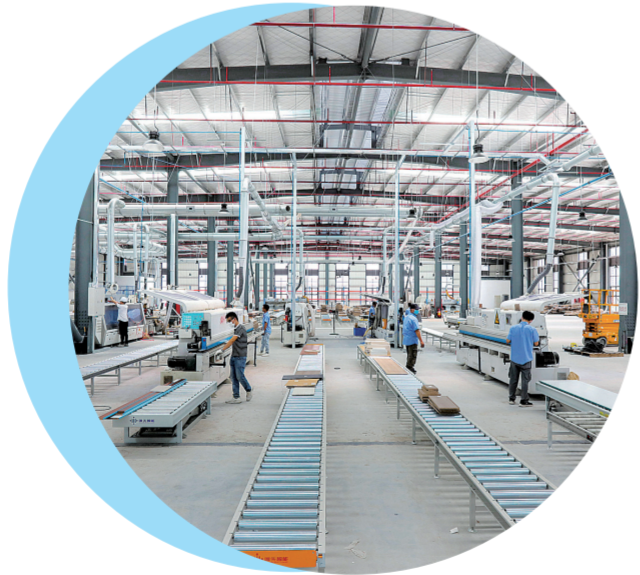
广东新标家居集团超级智能制造工业园一期试投产。