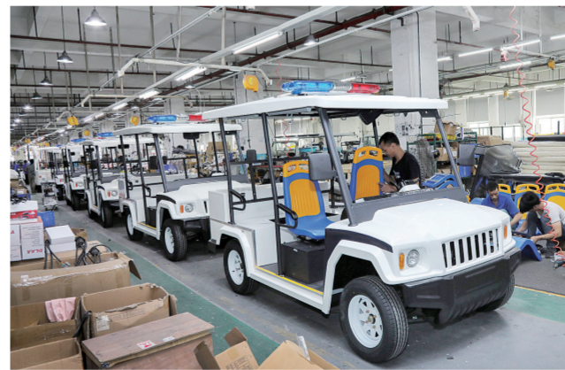
工人在玛西尔车间组装电动车。