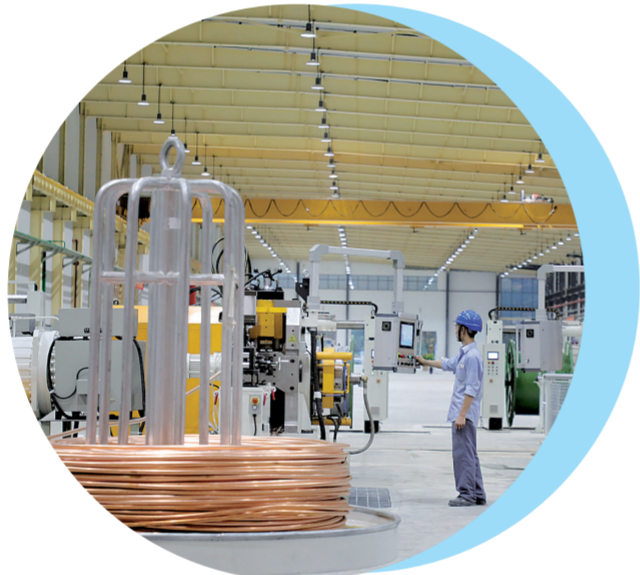
广东金田铜业有限公司一期项目。