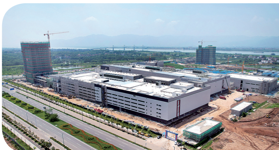
广东喜珍肇庆科技产业园(奥士康)项目外景。