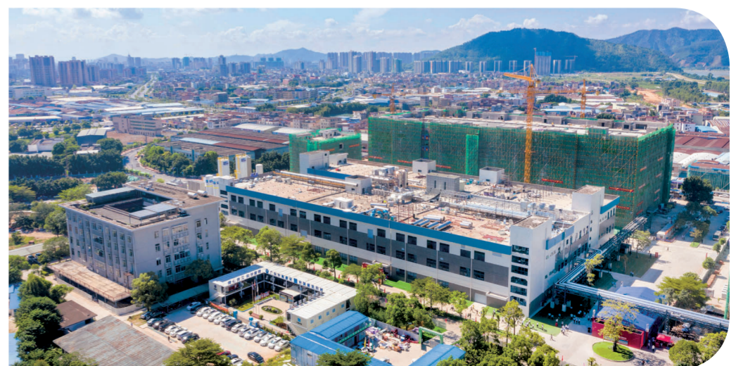
风华高科高端电容基地项目。