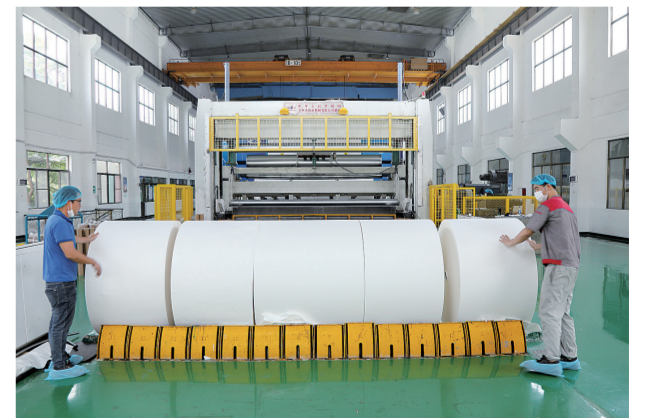
肇庆高新区山鹰纸业项目基地生产车间。