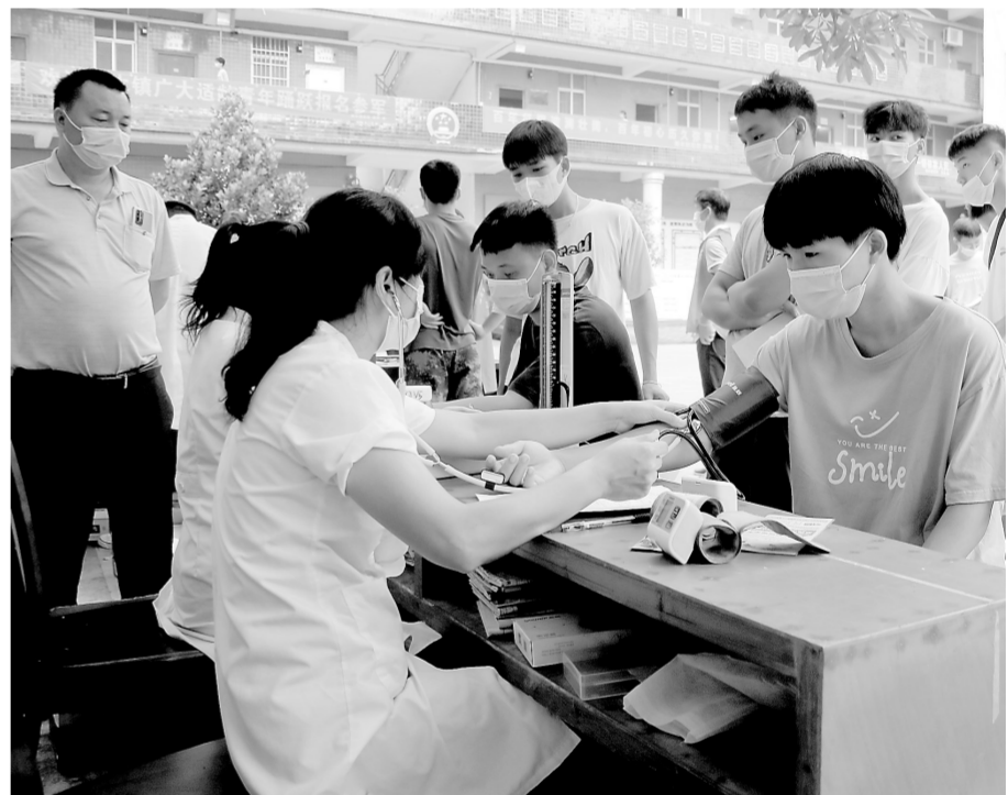
8月5日，桂平市南木镇开展秋季征兵体检工作，共有182名适龄青年参加初检，除血液检测项目外，其他项目初检合格人数117人，报名人数及参加初检人数均超过预期人数。图为初检现场。

本报讯 （记者欧钰宇 通讯员郑培莹）连日来，港南区木梓镇落实属地管理责任，多措并举抓好疫情防控工作。 该镇联合市场监管、卫生院等部门，开展中高风险地区返木梓人员全面排查工作。同时，制定了居家隔离人员专人负责制度，将居家隔离人员纳入统一管理范畴，每日安排医生上门测量体温、诊疗监测，随时掌握重点监测人员健康状况，把重点监测人员管控落到实处。 该镇在人员流动性大、人员聚集性强的农贸市场设立疫情监测卡点，成立防疫工作小组，实行三班轮值制对疫情监测卡点进行轮值值守。同时，对超市、饭店等重点公共场所体温测量、亮码通行、戴口罩等防控措施落实情况开展“日巡查、日监督”。并在各村设立疫情防控服务站，及时登记了解返乡人员信息，形成群防群治的良好局面。 该镇持续做好疫情防控宣传工作，通过印制宣传横幅、手写标语、播放广播、组织宣传车和工作组入户宣传等方式进行疫情防控宣传，教育引导群众提高警惕，做到不聚集、戴口罩、讲卫生等。截至目前，该镇已印制横幅150余条，手写标语100余条，发放宣传资料3200余份，通过多渠道、多方式的宣传手段，切实提升群众的自我防范意识。 该镇通过大数据比对、入户摸排等方式，利用微信、电话等联系未接种人员及时接种疫苗。同时，联合学区办和各学校对12-17周岁人群进行排查和动员接种，持续做好重点人群疫苗接种工作。至8月8日，该镇18岁以上人群第一剂覆盖率达72.35%，第二剂覆盖率达63.67%。