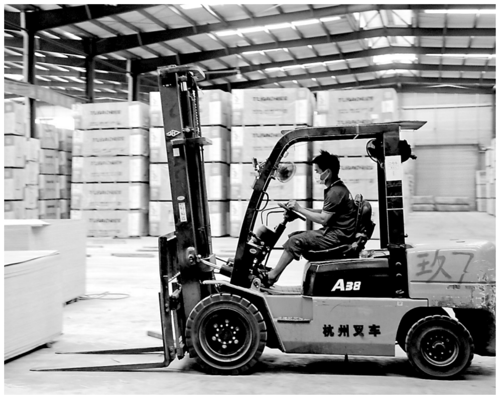
广西剑鑫木业集团有限公司位于市产业园区江南园，公司投资10亿元建设了广西、湖南两大产业发展基地，致力于研发、生产、销售各类高档家具板、大豆胶、无醛胶、负氧离子板、免漆生态板、三胺基材等，为两地提供3000多个就业岗位。图为8月11日工人在江南园产业发展基地生产车间工作。

推进疫苗接种“应接尽接”“应快尽快”。该区通过大数据信息比对及村（社区）干部入户核实等方式，全面摸排掌握疫苗接种进展情况。针对未接种疫苗的群众，组织村（社区）干部入户走访、乡镇（街道）干部疫苗接种工作小组入户动员，坚决做到横到边、纵到底，不漏一户不漏一人。截至8月5日，该区18岁以上人群已完成第一针接种428296人次，覆盖率80.70%；15至17岁人群累计接种32569剂次，第一针覆盖率80.08%；12至14岁人群累计接种34036剂次，首针覆盖率96.80%。