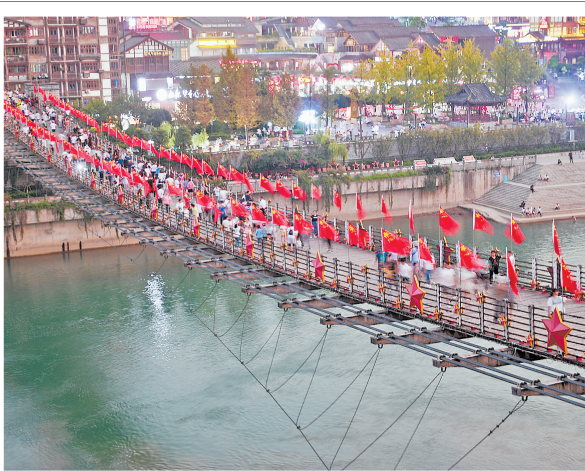
游客在贵州省仁怀市茅台镇茅台渡口铁索桥上参观（10月2日摄）。国庆长假期间，各地红色旅游景点人气旺，游客在红色旅游中厚植家国情怀。

了集团的防疫工作，并向市疫情防控指挥部捐赠了价值200多万元的防疫物资。公司党委在防控疫情方面积极作为，鼓励员工在分公司、猪场过年，减少人员流动，舒缓地方政府疫情防控压力。 今年3月26日，在我市“千企联千村 共建新农村”活动启动仪式上，高远飞表示，扬翔公司决策层已经达成共识，将充分发挥自身在农业农村工作中的优势与长期形成的科技力量，全力打造“料、养、宰、商”一体化产业模式，更好地服务乡村振兴工作，努力描绘“扬翔在千村，村村有扬翔，振兴有希望”的美好蓝图。当日，扬翔公司捐款2500万元，助力我市新农村建