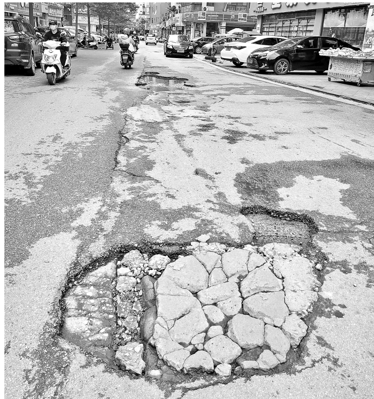
据市民反映，贵港城区江北和府小区和九龙新城小区之间的道路于2018年就出现了坑洼，由于坑多洼深，导致路过的市民摔倒。10月14日，记者走访时，发现该路段的部分坑洼已被附近店家简单填平，但还存有较多的坑洼，其中一个积水的坑长近3米、宽约1米。