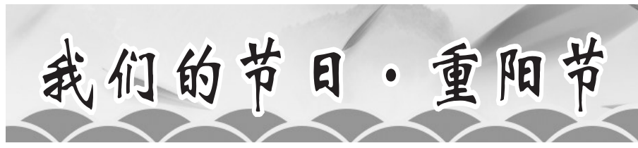
▲10月14日，贵港市嘉特电子科技有限公司开展重阳节慰问活动，到港南区瓦塘镇慰问老人231名，给他们送上慰问品，祝福老人身体健康、安享晚年。