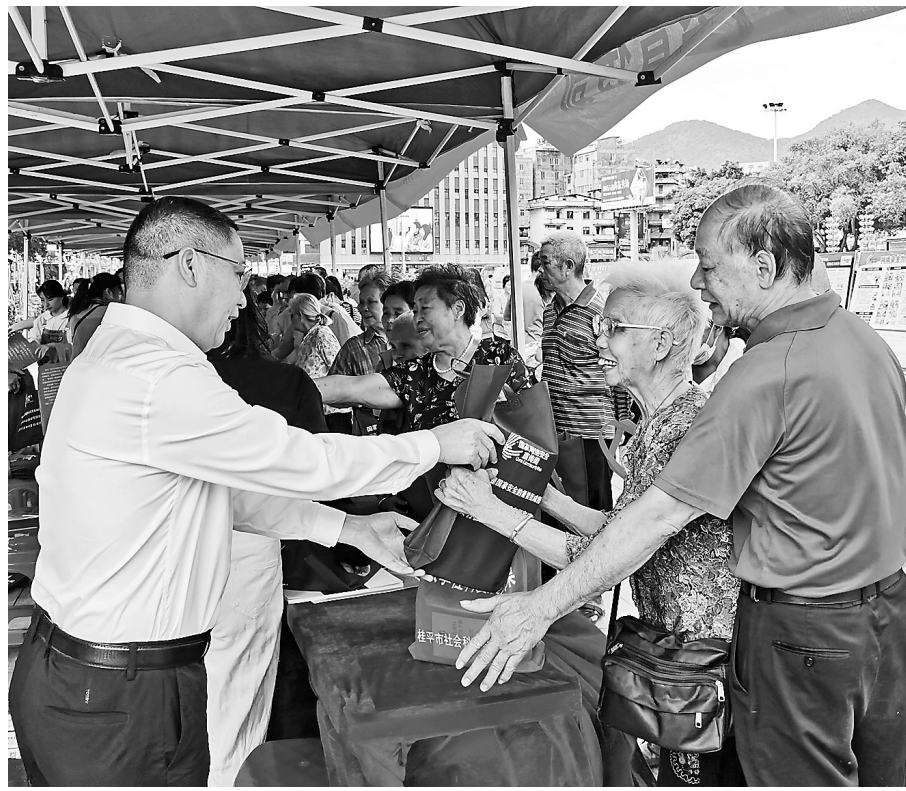
10月11日，桂平市启动2021年网络安全宣传周活动，现场向群众发放约1万份网络安全知识宣传资料，提升群众对网络安全的认识，携手共护网络安全。图为工作人员向群众发放宣传资料。