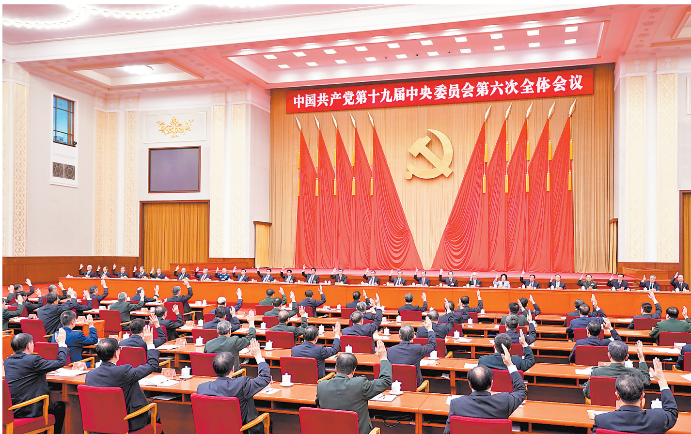
中国共产党第十九届中央委员会第六次全体会议,于2021年11月8日至11日在北京举行。中央政治局主持会议。