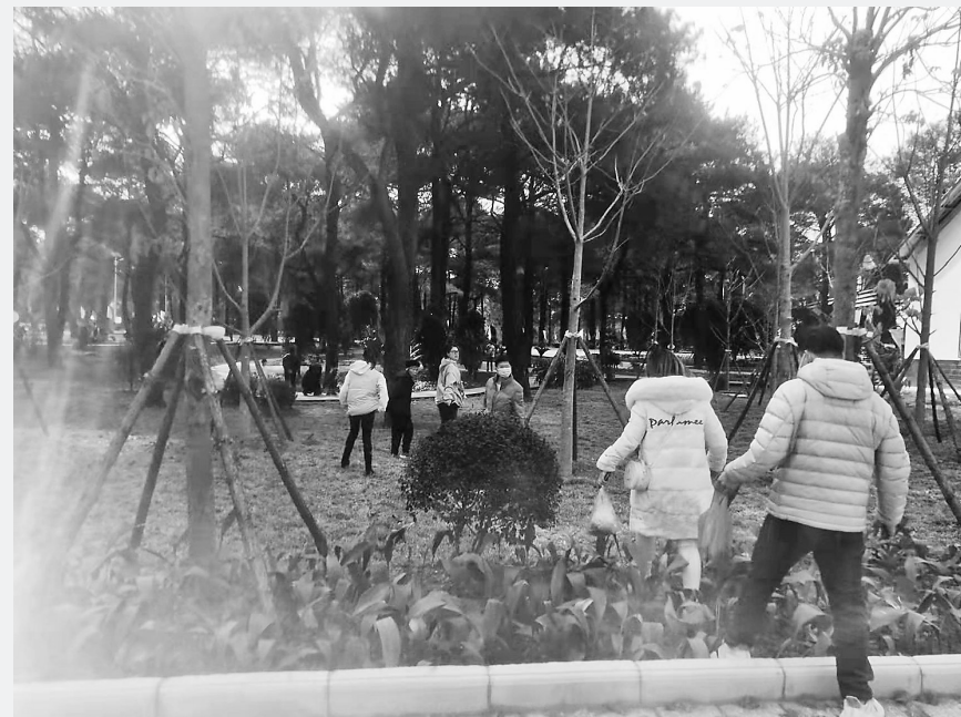
2月5日下午，贵港植物园停车场旁边，一排新种的花草被贪图方便的游客践踏。记者在旁边观察十多分钟，有不少游客从这里踩进去。像这样被游客抄近路踩踏出来的“捷径”在该植物园还有不少。（记者张思援）

立有多个“请勿靠近”“禁止嬉水”“深水危险”等提示牌，还有安全管理人员在江边巡逻劝导。尽管如此，记者仍看到有个别游客不顾危险跨安全区域，去到近水的乱石岸边玩乐。现场一名安全管理人员表示，一些游客不听劝阻到江边游玩，既不安全又不文明，还增加了码头安全管理的工作难度。 文明表现于细节，素质体现于言行。文明出游，需要大家在旅游过程中都能约束自己的行为，杜绝不文明行为。带孩子出游的家长更要以身作则，引导孩子文明旅游，带走美好回忆，留下文明之风，共同维护美丽风景、美好家园。