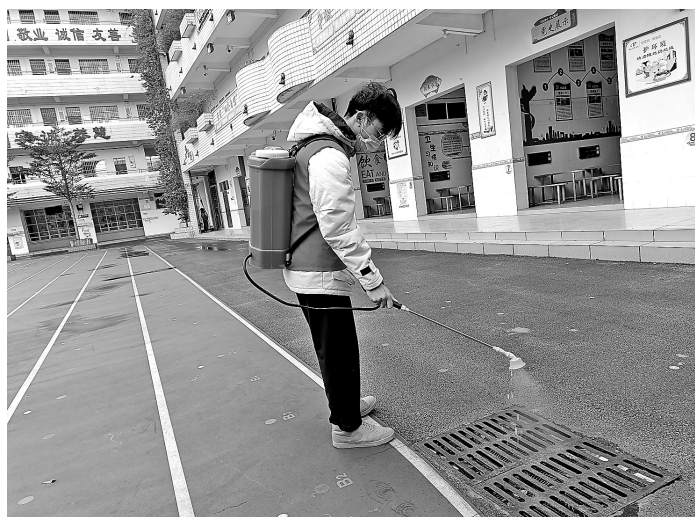
▲2月7日，我市青年志愿者到港北区石羊塘社区、凤凰社区等开展志愿服务，对街道、校园、垃圾池、下水道等进行清洁、消毒。图为志愿者在对校园下水道进行消杀。（记者杨小露 通讯员莫锦摄影报道）

连日来，全市各级各部门领导干部和志愿者下沉疫情防控一线，宣传防疫知识，排查风险隐患，筑牢疫情防控第一线。