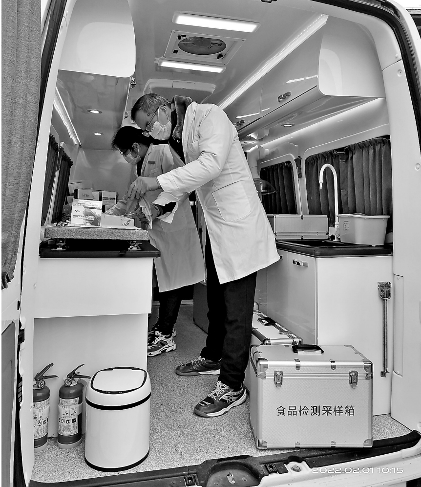
▲连日来，覃塘区市场监督管理局加强市场疫情防控监管，执法人员到各个市场、超市、药店、景区等检查食品安全和疫情防控措施。图为该局执法人员在食品点进行抽检。

▲春节期间，港南区木梓镇组织干部职工和返乡党员、大学生组成志愿者队伍，在农贸市场、车站、卫生院路口等地开展交通疏导和新冠肺炎疫情防控等工作。图为志愿者向群众宣传疫情防控知识。