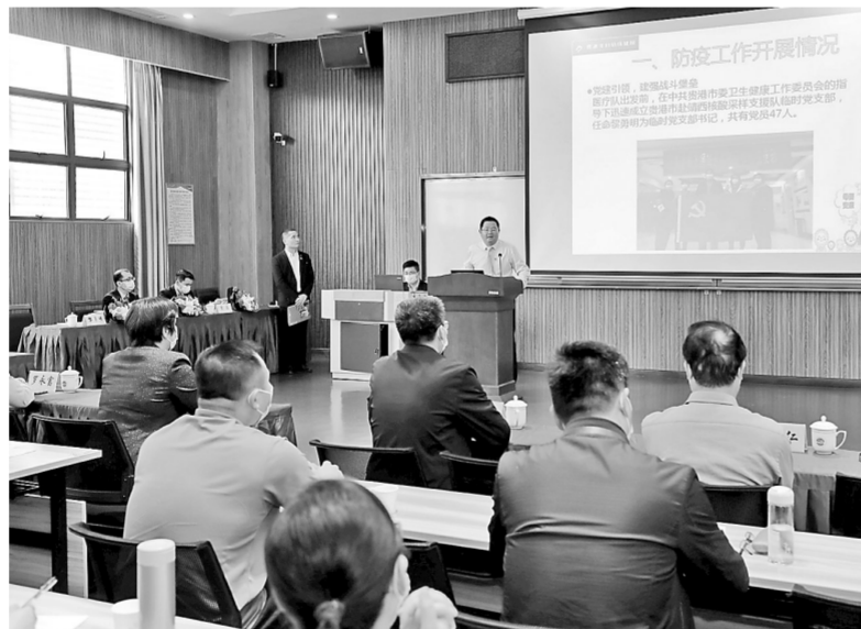
3月31日，市委党校党支部组织该校党员干部、我市第二十三期中青班学员开展“聆听抗疫故事 感受先锋力量”抗疫事迹分享会暨“党员心声大家谈”活动，活动主要有观看抗疫短视频、为抗疫英雄献花、聆听抗疫故事、交流心得体会等。图为活动现场。

本报讯（记者刘锐军）3月31日至4月1日，港北区荷城小学开展主题为“浅浅三月绿 浓浓民族情”“壮族三月三”系列活动，伴随着悠扬的伴奏声，身穿绚丽多彩的壮乡服饰的学生参加了民乐、民歌、民舞比赛。 活动当天，一个个身穿各色民族服饰的参赛学生分别演唱民歌，演奏古筝、葫芦丝、陶笛、二胡等，以及进行民族舞蹈表演，赢得了现场观众的赞叹和掌声。据悉，该校在做好疫情防控的前提下，开展此次活动，活动包括“壮族三月三”主题拉歌、体育运动会、民俗美术作品展、民族音乐比赛等。