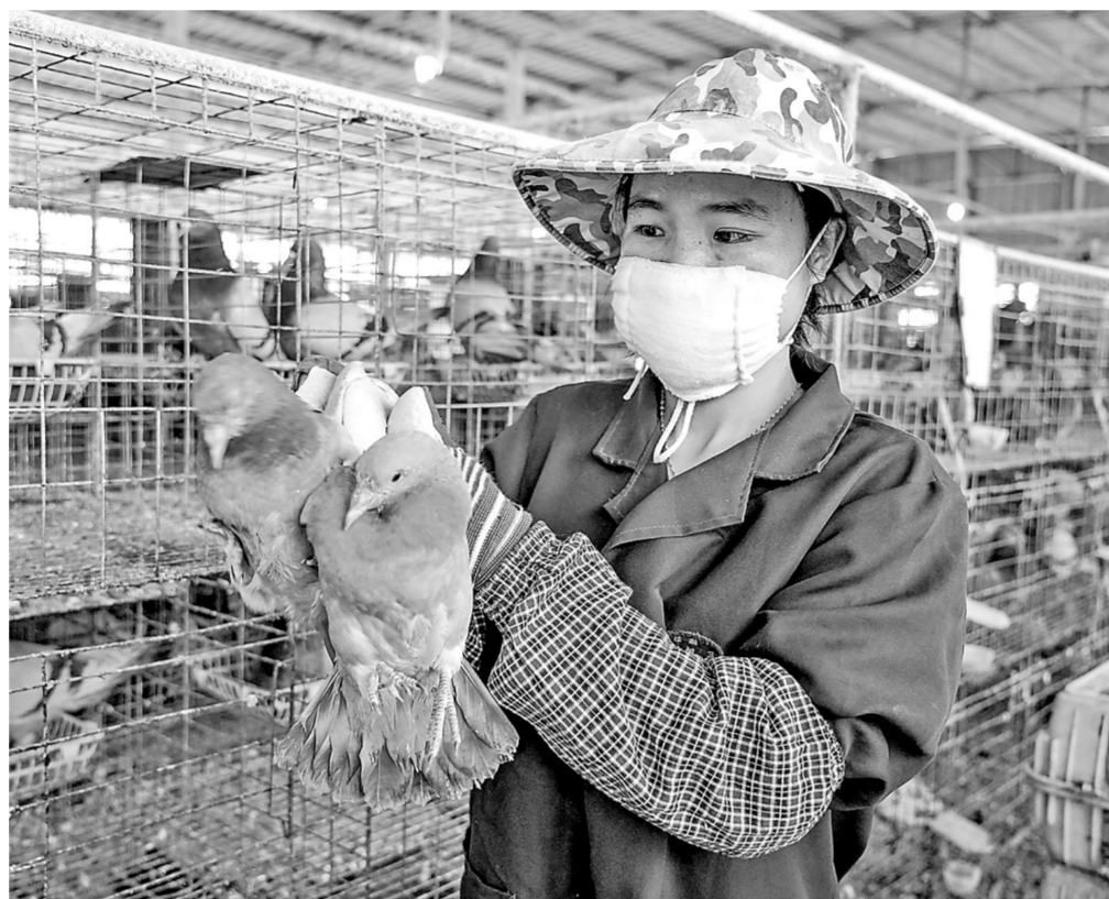
港南区湛江镇吉柳村吉丰肉鸽养殖示范园每年可供应种鸽5万对，出栏乳鸽200多万羽，鸽蛋50多万枚，主要在本地销售及销往周边省、市，年总产值2000多万元。该示范园通过“示范园+合作社+农户”的模式，吸纳26户农户入股，每年每户平均增收2万多元；为群众提供20多个就业岗位，人均月收入3000多元。图为3月29日，农户在查看种鸽生长情况。

本报讯（见习记者李奇琛）4月2日上午，市关心下一代工作委员会、市残疾人联合会、荷城义工协会等联合开展关注“自闭症家庭”学术活动暨义诊活动。 今年4月2日是第十五个世界自闭症日。当天，市关心下一代工作委员会、市残疾人联合会等为自闭症家庭提供自闭症科普、免费家长心理咨询以及自闭症孩子多学科会诊服务，呼吁社会各界进一步关心关爱自闭症儿童，对自闭症儿童及其家长的心理问题引起重视，让这些“星星的孩子”可以在早期接受诊断和干预、在社会重视和帮扶下健康成长。