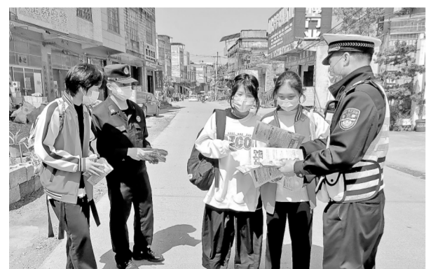
4月2日至6日，覃塘区开展“壮族三月三”、清明节“文明祭祀 平安清明”专项宣传，向群众发放宣传资料、播放典型事故案例、讲解安全知识等，倡导群众文明祭祀，提醒群众注意用火安全、文明出行。图为活动现场。