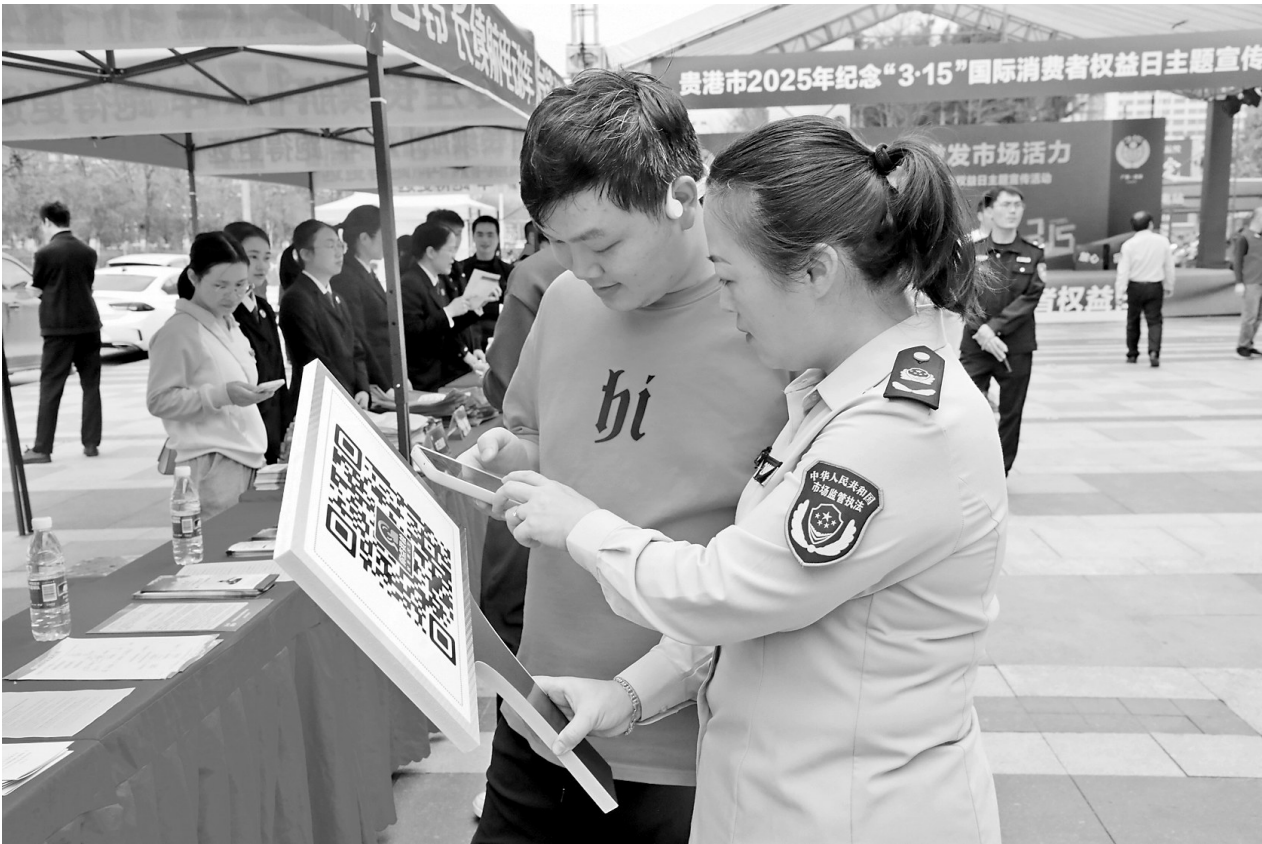
3月13日，我市在万达广场开展2025年纪念“3·15”国际消费者权益日宣传活动。工作人员现场为广大市民普及消费方面的法律法规及消费者权益的热点知识，并向群众讲解商品真假的鉴别方法。51家单位、企业参与宣传活动，累计接受群众咨询300多人次，发放宣传手册、公益读本、宣传环保袋等共1000余份。图为活动现场。

“选择正规的店铺消费”“选择知名品牌”“要积极维权”……采访期间，记者发现市民都具有较强的消费维权