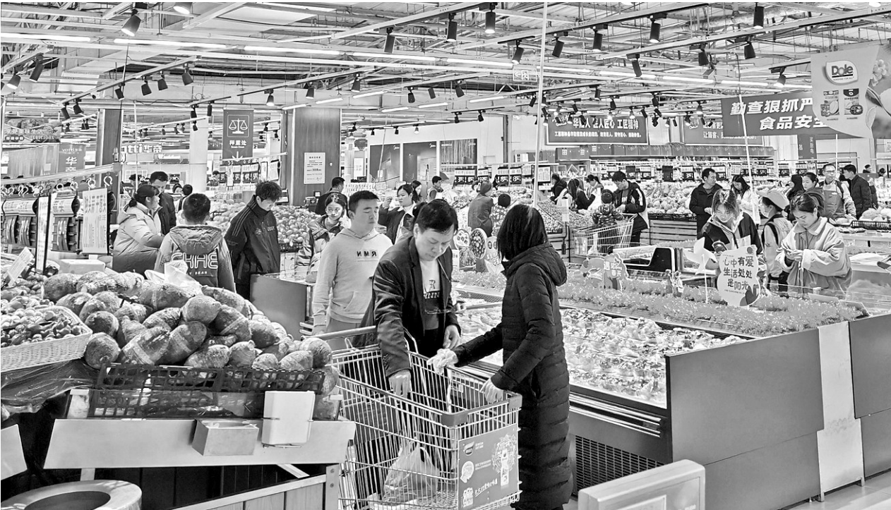
图为3月8日消费者在我市某购物超市挑选商品。