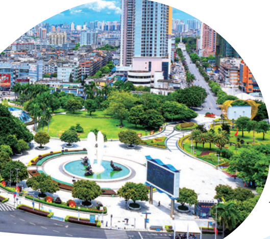
北部湾广场新景。