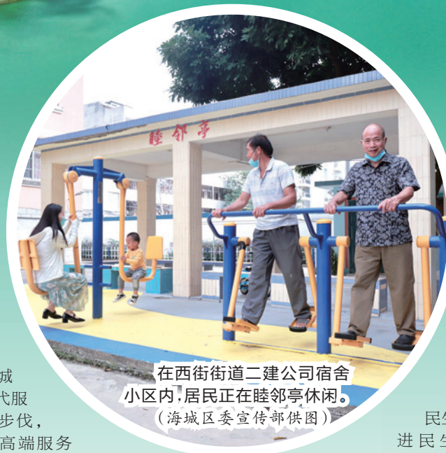
在西街街道二建公司宿舍小区内，居民正在睦邻亭休闲。