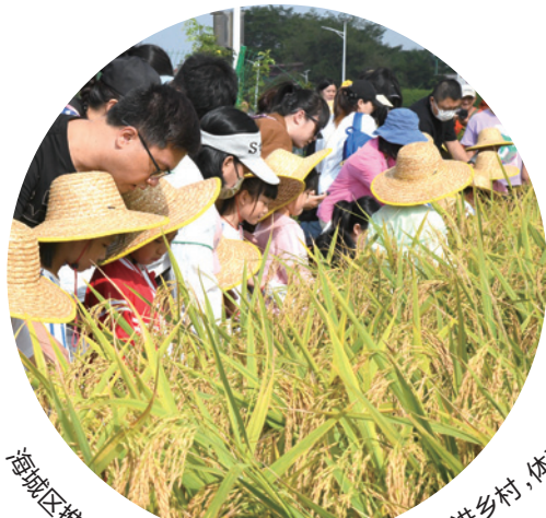
海城区推行“研学+乡村”模式，让中小走进乡村，体验农耕文化。