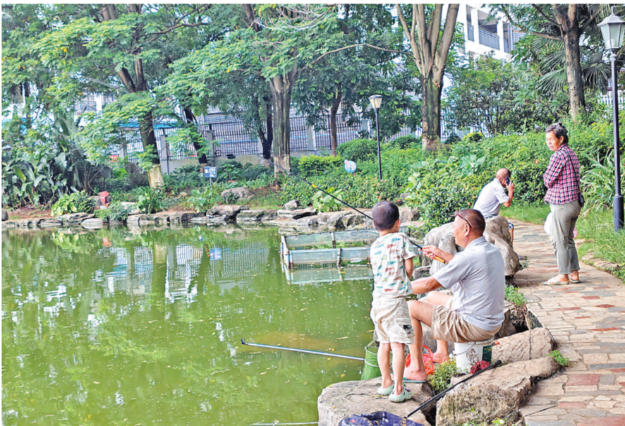
8月5日清晨，记者看到，有市民在东湖边钓鱼。

“这些年，东湖生态改善的成效，大家都有目共睹。特别是水体治理之后，整个东湖焕然一新。随着东湖的生态环境越来越好，各种各样的鸟儿都选择在这儿安家落户，其中，白鹭最为引