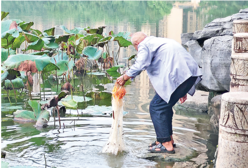
8月6日清晨，一位80多岁的老人在东湖边捕鱼。