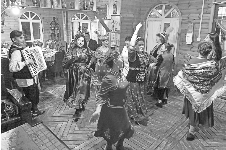
9月17日，客人们在餐后跳舞。