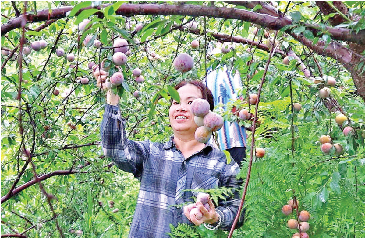
图为工人在采摘三华李。

本报讯 （全媒体首席记者陈榕玲 通讯员钟健 莫敏兰）六月，正是岭南佳果飘香的黄金时节。6月25日，在平南县丹竹镇长岐塘村的燕洲果场，漫山遍野的李子树枝桠被累累硕果压弯，工人们在葱郁林间穿梭忙碌，小小的三华李正成为丹竹镇乡村振兴路上强劲的“甜蜜引擎”。 记者走进燕洲果场，只见工人正细心采收成熟李子。新摘下的李子身披紫红色外衣，裹着淡淡的银粉，色泽诱人。轻咬一口，薄脆果皮迸出酸甜汁液，紧实脆爽的果肉带来绝妙口感，先是恰到好处酸度，随后清甜回甘绵长，令人欲罢不能。这份独特风味，得益于当地典型的丘陵地貌与温暖湿润的气候，当地丰沛的雨量、充足的光照搭配深厚肥沃的土壤孕育出的“银钗”三华李，个头匀称、酸甜适中，备受客商和消费者青睐。 “今天就收到订单了，明天摘1万多斤。”平南县燕洲村养殖专业合作社负责人吴正钊介绍。果园边，装满李子的果桶迅速运往临时分拣点。合作社采用灵活高效的运作模式，按需协调采摘量，社员抱团闯市场，共担风险、共享利益，保障了果品供应与市场资源共享。吴正钊介绍，他种植近100亩，今年预计能摘5万多公斤。 近年来，丹竹镇紧扣市场需求与产业升级趋势，大力推动水果产业融合发展。以“绿色、多元、品牌”为核心，在巩固传统优势品种的同时，推动番石榴、大青枣、沃柑等特色水果产业协同发展，打造“四季有果、特色鲜明”的产业格局。如今，三华李已成为丹竹镇水果产业的亮眼名片。今年，全镇李子种植面积达1754亩，预计总产量超3280吨。全镇还建成20多座保鲜冷库，配套专业化分拣中心和包装厂，为产业发展和农民增收筑牢根基。